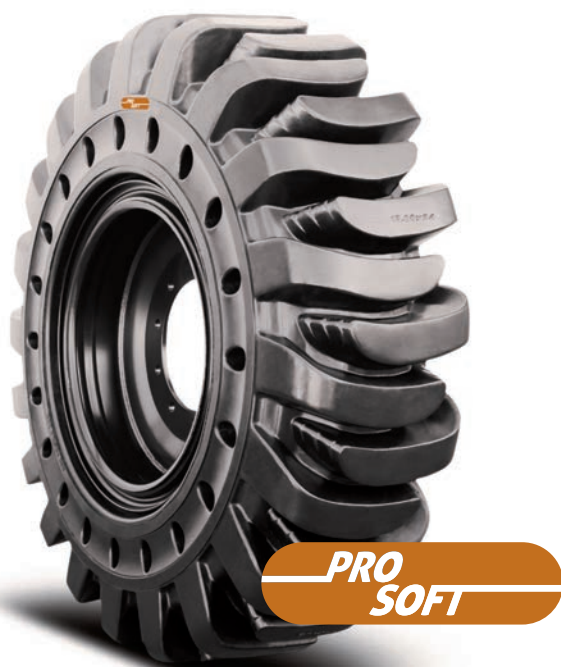
HPS Solidflex Traction