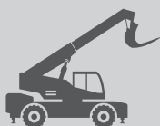
MANIPULADORES DE TELESCÓPICOS